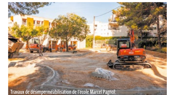
Travaux de désimperméabilisation de l'école Marcel Pagnol.

La désimperméabilisation s'illustre avec l'achèvement durant l'été de l'école Marcel Pagnol. Après une première phase opérée durant l'année 2022, les cours proposent désormais des espaces végétalisés, un sol clair, et ce, tout en préservant les essences présentes. L'objectif est de faciliter l'infiltration des eaux pluviales, tout en luttant contre les îlots de chaleur. Lorsque cela s'est avéré nécessaire, la ville a procédé à des mises en peinture, des travaux de menuiserie et autres opérations visant à embellir les écoles et améliorer le confort des élèves comme des professeurs. Les travaux annuels dans les écoles représentent 795 000 €, auxquels il faut ajouter cette année 1 M € pour la réalisation de l'école temporaire Jean Jaurès.