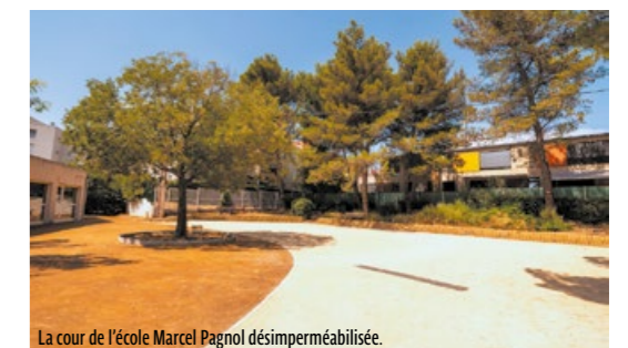
La cour de l'école Marcel Pagnol désimperméabilisée.