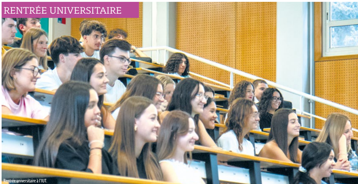
Reentrée universitaire à l'IUT.