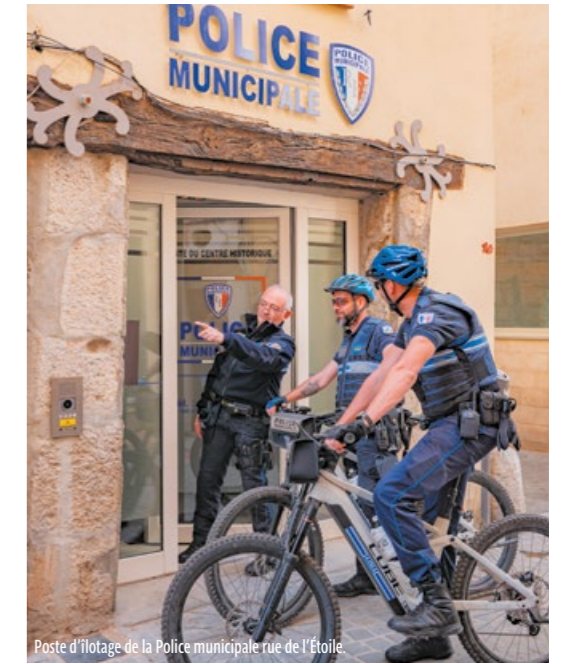
Poste d'ilotage de la Police municipale rue de l'Étoile.