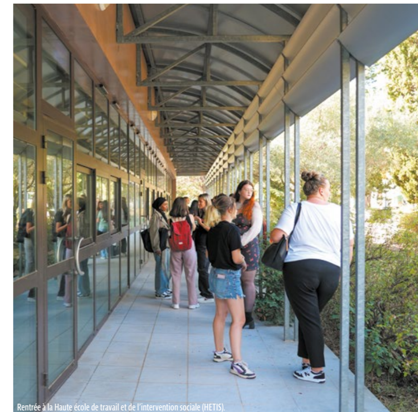
Reentrée à la Haute école de travail et de l'intervention sociale (HETIS).

À ce panorama s'ajoutent les formations dispensées par des organismes privés proposant le plus souvent des formations en alternance (ACAMAN, CFD, B Factory, CAPFORMA, ES Banque).