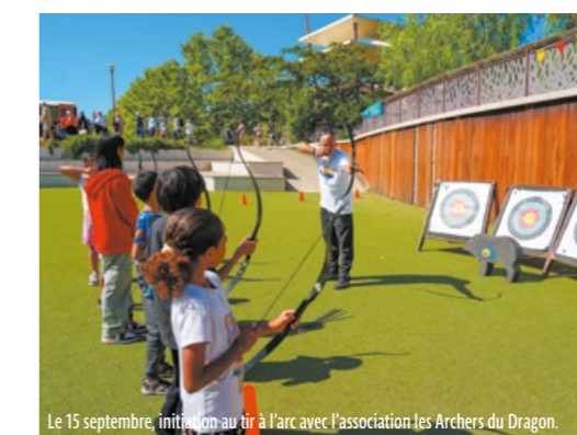
Le 15 septembre, initiation au tir à l'arc avec l'association Les Archers du Dragon.