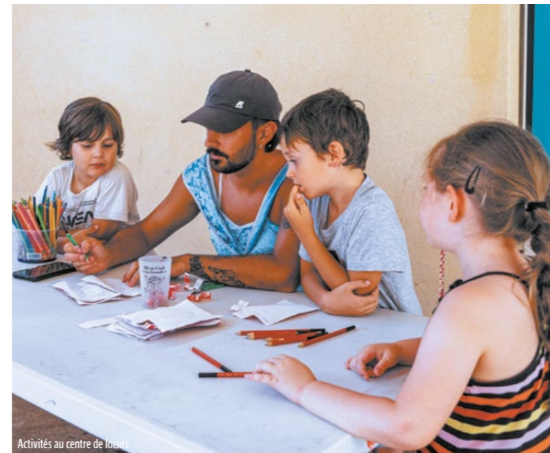
Activités au centre de loisirs.