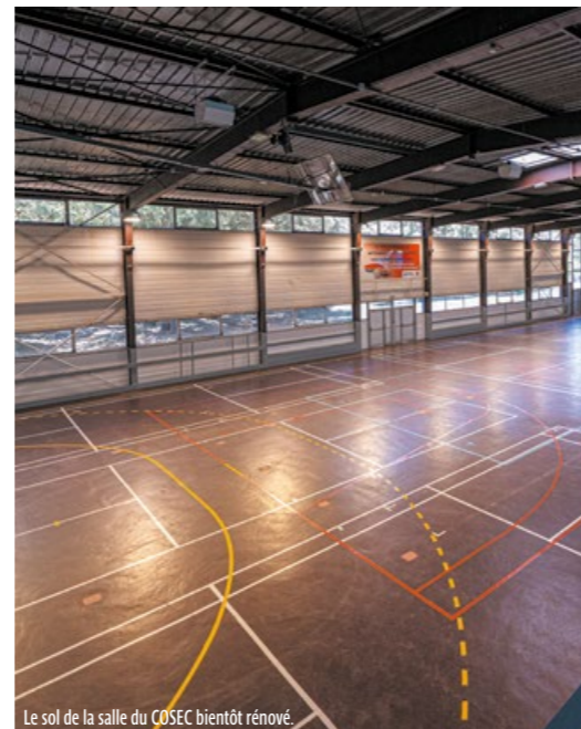
Le sol de la salle du COSEC bientôt rénové.

Le coût global de ces 3 opérations s'élève à 905 000 € TTC, conjointement financé à hauteur de 467 726 € par l'État, la Région, le Département et l'Agence nationale du sport, soit plus de 50 %.