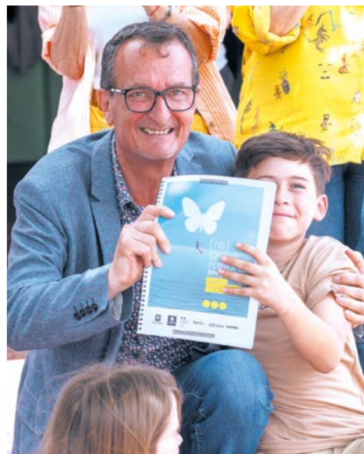
Projet Neede mis en place à l'école Paul Arène en 2023-2024.

Après une année à travailler au sein du groupe scolaire Paul Arène, l'association Neede accompagne désormais l'école des Marronniers. Tout au long de l'année, les enseignants, les enfants, l'ensemble des personnels ainsi que leurs prestataires vont être sensibilisés et formés à la transformation de leurs usages. À travers des ateliers pédagogiques, ils bénéficieront d'une analyse de leur empreinte carbone pour la réduire au maximum, et ce, au niveau énergétique, alimentaire, mobilité, etc. Outre l'adoption de bons comportements, cette sensibilisation vise à favoriser la compréhension par tous des enjeux de la transition écologique dans leur globalité.