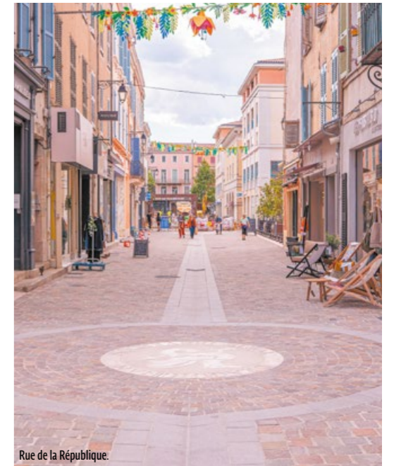
Rue de la République.

Pour rappel, ces réaménagements permettent de rénover les canalisations d'eau potable, d'eau pluviale et d'eaux usées datant de 1972. Ils sont également l'occasion d'embellir le cœur de ville et d'assurer une cohérence entre les différents aménagements périphériques, entre le boulevard Clemenceau et la place du Marché.