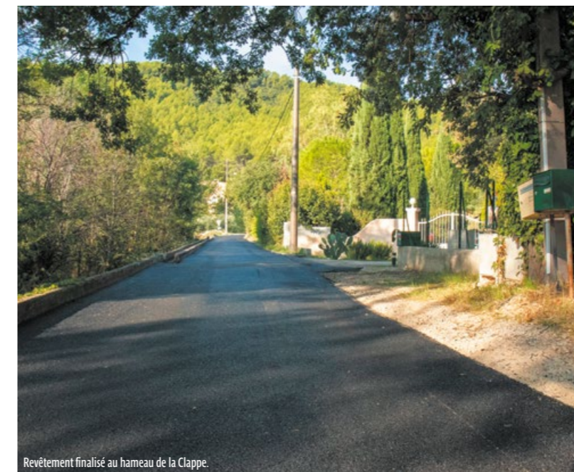
Revêtement finalisé au hameau de la Clappe.

En ce qui concerne le rond-point Daniel Mayer et le parking de la Jarre, les trottoirs ont été repris avec un abaissement de bordure dans le but de sécuriser les traversées piétonnes et de faciliter l'accès des personnes à mobilité réduite. Le coût total représente 8 000 € TTC.