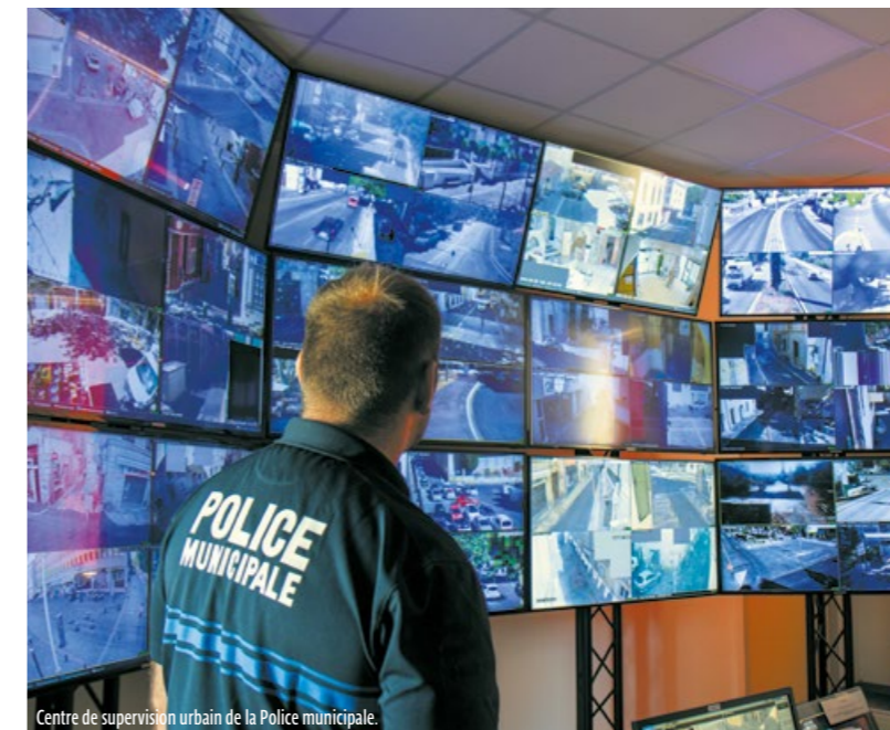
Centre de supervision urbain de la Police municipale.

Cet effort est fait alors que depuis les attentats terroristes de 2015, les mesures de sécurité pèsent toujours plus fortement sur le budget de la commune qui doit recourir à des acteurs privés de sécurité (société de gardiennage et association de sécurité civile) lors de nombreuses animations et cérémonies. Idem pour la mise en place par les services techniques municipaux de protection contre les véhicules béliers.