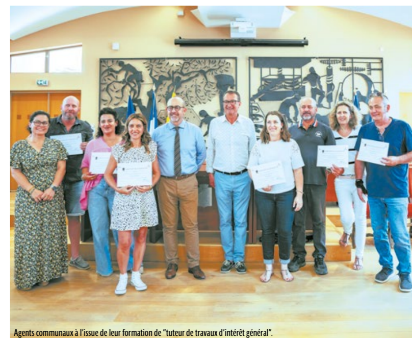
Agents communaux à l'issue de leur formation de "tuteur de travaux d'intérêt général".