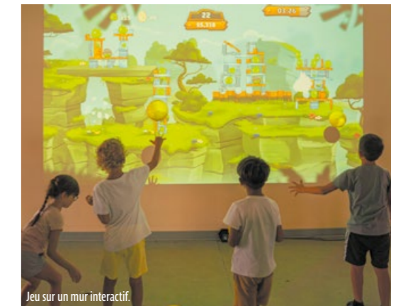
Jeu sur un mur interactif.

Toutes les activités mises en œuvre par la direction Enfance, jeunesse et sports de la commune ont pour objectif de développer les compétences et les connaissances des enfants. Leur ambition est de créer un environnement éducatif épanouissant, tout en accompagnant les enfants et les jeunes dans la construction de leur parcours.