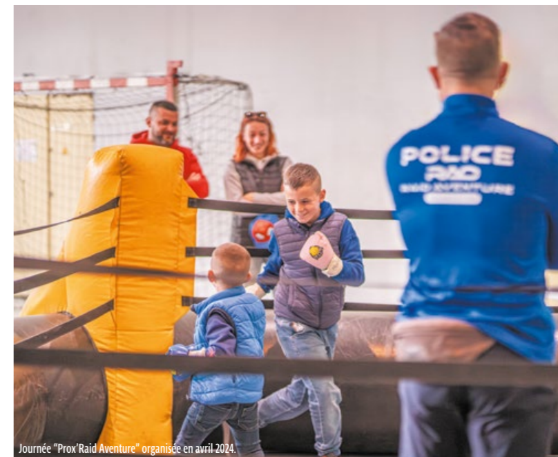
Journée "Prox'Raid Aventure" organisée en avril 2024.

Concernant les petites infractions, la ville travaille avec les services de la justice pour favoriser les travaux d'intérêt général (TIG). Cette peine, utile pour tous, permet au condamné de réparer le passé en effectuant un travail sans rémunération dans l'intérêt collectif, tout en préparant l'avenir. Il découvre une activité professionnelle et implique directement la société civile, ce qui favorise le lien social. Dix agents de la commune ont été formés pour devenir tuteurs de tigestes, garants de la bonne réalisation de la peine. Ils accueillent la personne condamnée dans un cadre de confiance et font preuve d'autant d'empathie que de pédagogie pour l'accompagner dans sa tâche.