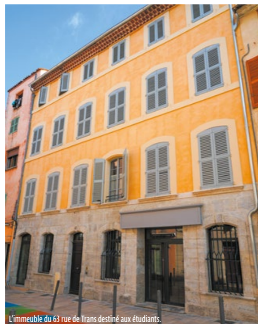
L'immeuble du 63 rue de Trans destiné aux étudiants.

1,6 M€ financé par des prêts de la Caisse des dépôts et consignations, contractés par la SAIEM