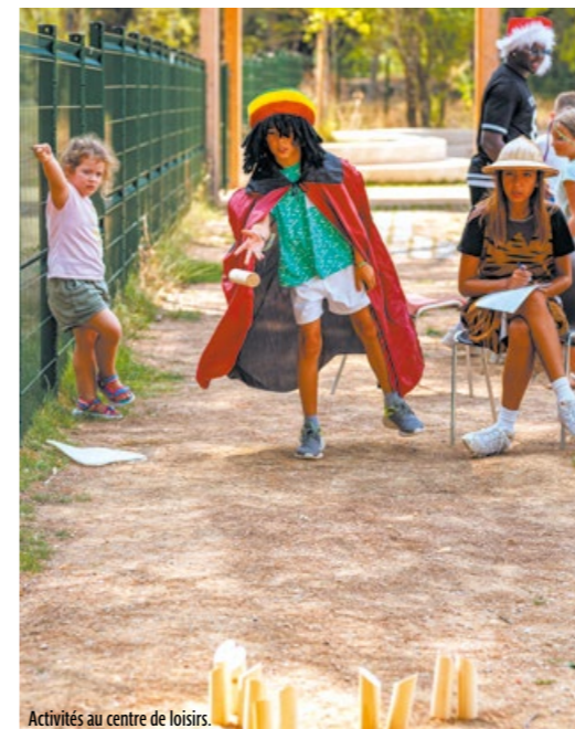
Activités au centre de loisirs.