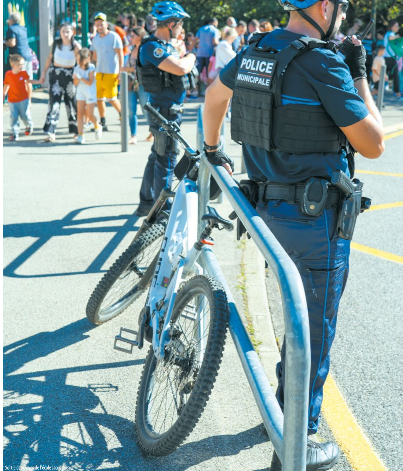
Sortie des élèves de l'école Jacques Brel.

La tranquillité publique est un engagement prioritaire au quotidien. Une mobilisation de tous les instants pour la sécurité, la sûreté, la salubrité et la sauvegarde de l'ordre public.