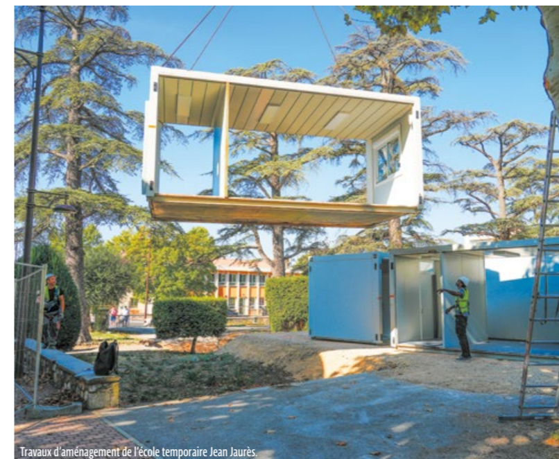
Travaux d'aménagement de l'école temporaire Jean Jaurès.

Pour les étudiants, l'offre de formation universitaire s'étoffe à nouveau cette année. Nous avons toujours à cœur de proposer des filières cohérentes avec les besoins des acteurs du territoire et des secteurs économiques recrutant, et ce, afin de faciliter l'insertion professionnelle des étudiants une fois leur diplôme obtenu. C'est une chance pour tous les Dracénois de pouvoir suivre des études supérieures près de chez eux et à moindres frais. Avec 3 554 élèves et plus de 1 100 étudiants, la ville fait de l'éducation et de l'enseignement une priorité de son engagement municipal."