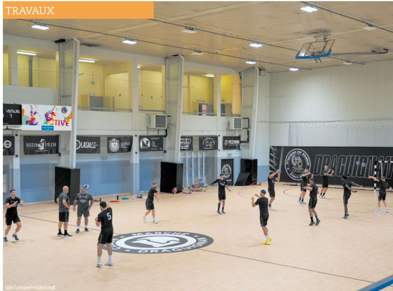
Salle Carbonnel refaite à neuf.