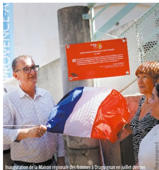
Inauguration de la Maison régionale des femmes à Draguignan en juillet dernier.