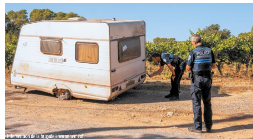
Intervention de la brigade environnement.

De manière générale, les policiers municipaux exécutent les tâches relevant de la compétence du maire en matière de prévention et de sauvegarde de l'ordre public. Ils assurent l'exécution des arrêtés de police du maire et constatent les contraventions auxdits arrêtés. Ainsi l'activité répressive pour la préservation du cadre de vie s'intensifie en règle générale, et en particulier en ce qui concerne la lutte contre les dépôts sauvages de déchets. En ce sens, la Police municipale dispose d'une brigade de l'environnement. Enfin, en leur qualité d'agents de police judiciaire adjoints, les policiers municipaux peuvent constater un certain nombre de contraventions, dont celles relatives au Code de la route. Les policiers municipaux sont armés. Retenant les enseignements des attentats, la municipalité estime cette mesure nécessaire pour leur sécurité d'abord, car ils peuvent être des cibles, ensuite car ils ont aussi une capacité de primo-intervenants en cas de problème majeur.