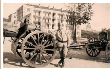
Le 363° RALP avec un canon de 155mm dans le Quartier Chabran avant guerre.