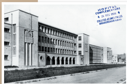
Le collège de jeunes filles en 1939.